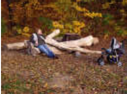
lavice - obora Hvězda, Praha

PLOCHA A MNOŽSTVÍ SEDIMENTU = 1451 m 3 MNOŽSTVÍ VODY = 1000 m 3 TECHNOLOGIE ODBAHNĚNÍ SACÍ BAGR - 1000 m 3 SEDIMENTU KLASICKÁ VÝKOPOVÁ TECHNOLOGIE - 451 m 3